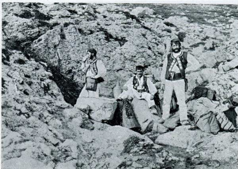
Izvor Pećica na V. Libinjama

Po dolasku Turaka u 16. stoljeću, prema narodnom pripovijedanju, neki se beg htio naseliti u Kosinju. Kako su se Turci najčešće naseljavali u blizini žive vode, obiđe beg či-